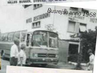
Busrejse anno 1968