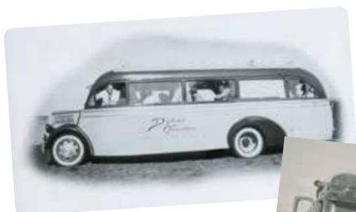
Nille i sin første bus