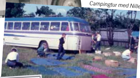
Campingtur med Nille.