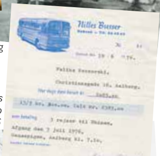
Rejsebevis anno 1976