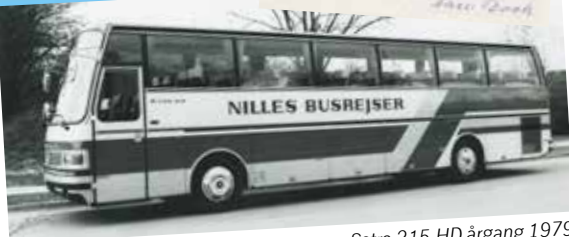
Setra 215 HD årgang 1979