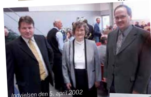
Indvielsen den 5. april 2002