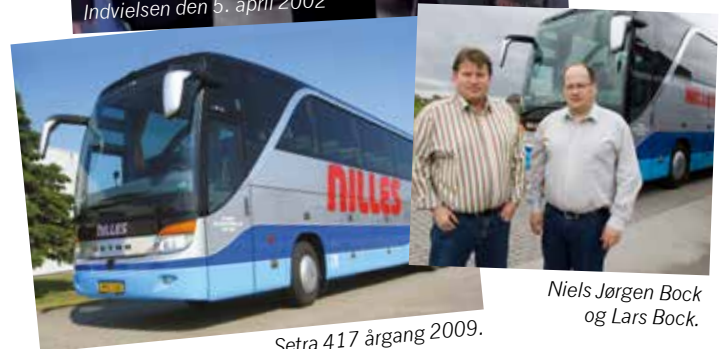
Setra 417 årgang 2009.