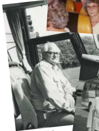
Nille bag rattet